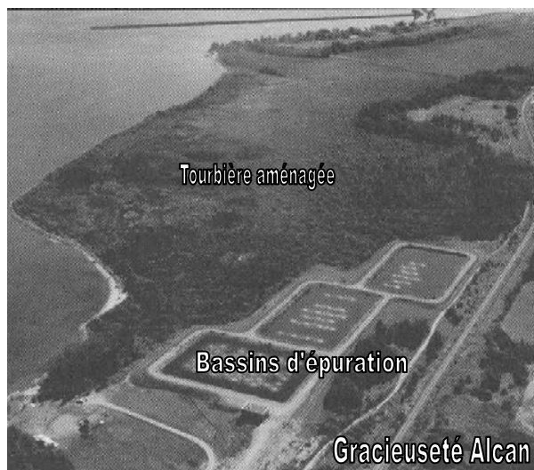
Vue aérienne de cette tourbière de 30 hectares.

Cette partie n'ayant pas d'ouvrage de retenue, la tourbière s'assèche pendant l'été car l'eau est drainée dans le lac Saint-Jean. Des conditions plus sèches sont alors moins favorables pour la faune. La biodiversité et la productivité sont toujours plus grandes quand il y a de l'eau.